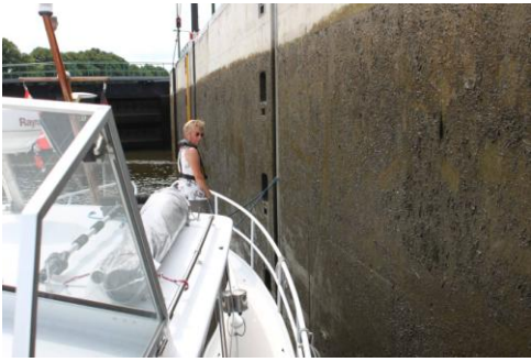
4.5 m sluse.