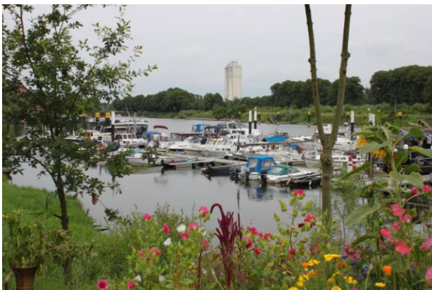
Typisk tysk havn langs med kanalerne.