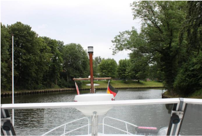
Smal kanal, indsejling til Lybæk

Vi gik en tur op i Lybæk for at finde noget at spise, vi kom til et lille sted nede ved kanalen hvor vi kunne sidde under en parasol og spise. Pludselig begyndte det at styrt regne, så vi måtte sidde med vores paraply for at dække for slagregnen, mens vi sad i læ under parasolen, det var lidt specielt, men vi kunne kun grine af det. Da vi var færdige med at spise klarede det lidt op så vi kunne gå hjem i tørvejr.