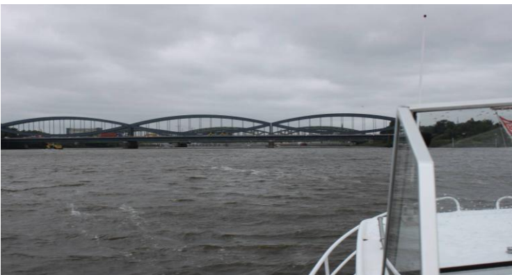
Indsejling til Hamburg.